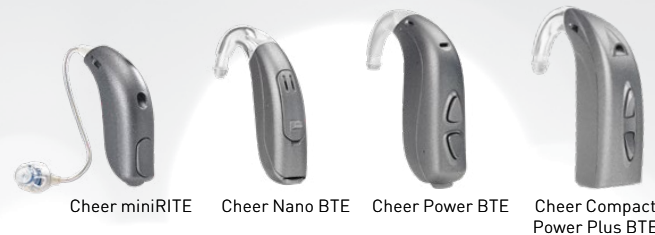
Cheer miniRITE Cheer Nano BTE Cheer Power BTE Cheer Compact Power Plus BTE