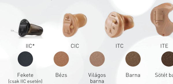
IIC* CIC ITC ITE Fekete (csak IIC esetén) Bézs Világos barna Barna Sötét barna

A szinte láthatatlan IIC-től az erőteljes BTE-n keresztül a Cheer mindenféle kialakítású hallókészüléket felsorakoztat. A Cheer többféle színben érhető el, és a legtöbb vezeték nélküli kapcsolattal rendelkezik. Érdeklődjön audiológusánál, hallásgondozó szakembernél az Ön számára megfelelő hallókészülékért.